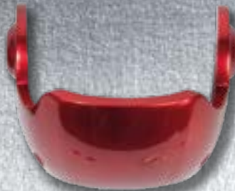
24В Внешняя наплечная пластина