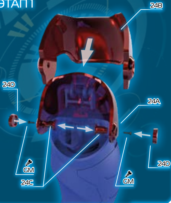
РЕЗУЛЬТАТ СБОРКИ НАПЛЕЧНИКА (2)