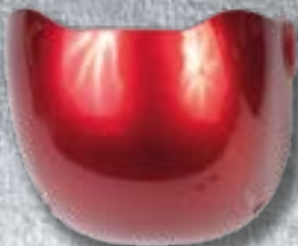
24А Внутренняя наплечная пластина