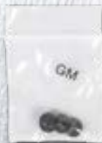
GM 2,0 x 3 x 6 мм